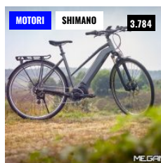
SHIMANO STEPS E6100, UNA NUOVA GENERAZIONE