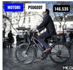
PEUGEOT PRESENTA LA GAMMA 2017 DI E-BIKE