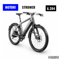
BRINKE PRESENTA LA NUOVA E-BIKE STROMER ST5