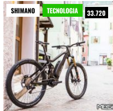
SHIMANO, L'EVOLUZIONE DELLA BICICLETTA