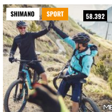
SHIMANO È SPONSOR UNICO DI BIKE UP