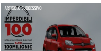
FIAT E LANCIA, 100 MILIONI DI INCENTIVI!